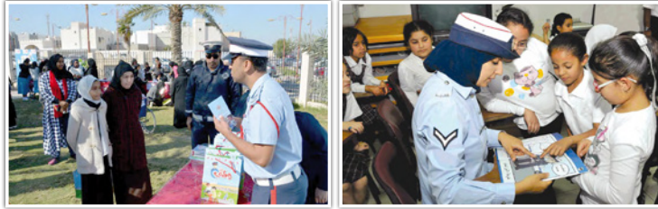
منصة تسجيل التطوعين إحدى مبادرات «بحريننا... مسؤولون ومواطنون»