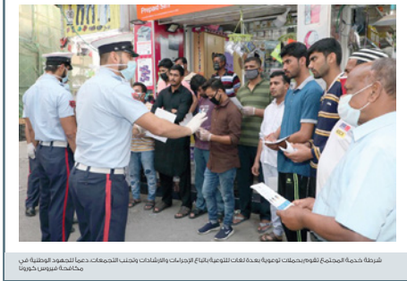
شركة خدمة المجتمع تقوم بحملة توعوية بعدة لغات (الوطنية، العربية، الإنجليزية) وإجراءات وأبحاث خاصة بالخدمات الصحية الوطنية في مكتبة حبيب خويما