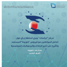
مركز «دراسات» يدرس استطلاعاً حول تعامل المواطنين مع فيروس كورونا، وتأثيره على تغير العادات والسلوكيات المجتمعية.

يتناول تأثير الفيروس على تغير العادات والسلوكيات